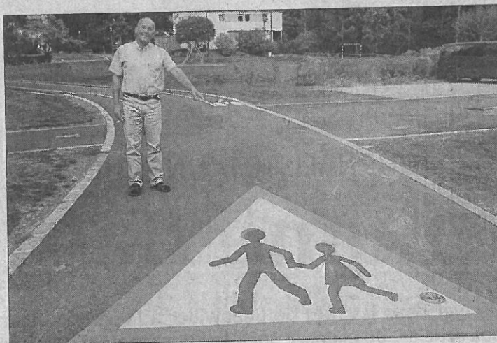
Difficile de ne pas voir le panneau à l'entrée du tracé.

Apprendre les risques et les dangers de la circulation au sein de son établissement, c'est ce que propose l'association Maison d'enfants Le Bercaïl dans son parc à Guebwiller, depuis la rentrée, grâce à une piste de prévention routière. Ce cheminement accessible aux piétons et aux vélos mais aussi aux trottinettes et autres planches à roulettes sera inaugurée officiellement mercredi 7 octobre à 16 h, en présence de la Fondation Passions Alsace. En effet, ce projet dans les cartons depuis quelque temps déjà est remonté à la surface lors d'une réunion du Conseil à la vie sociale (CVS) et a vu le jour grâce au dossier déposé auprès de la Fondation.